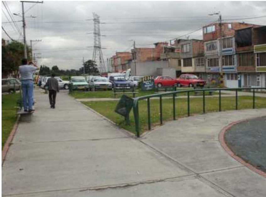
Calle 58 A sur Carrera 43 A. Ciudad Bolívar.