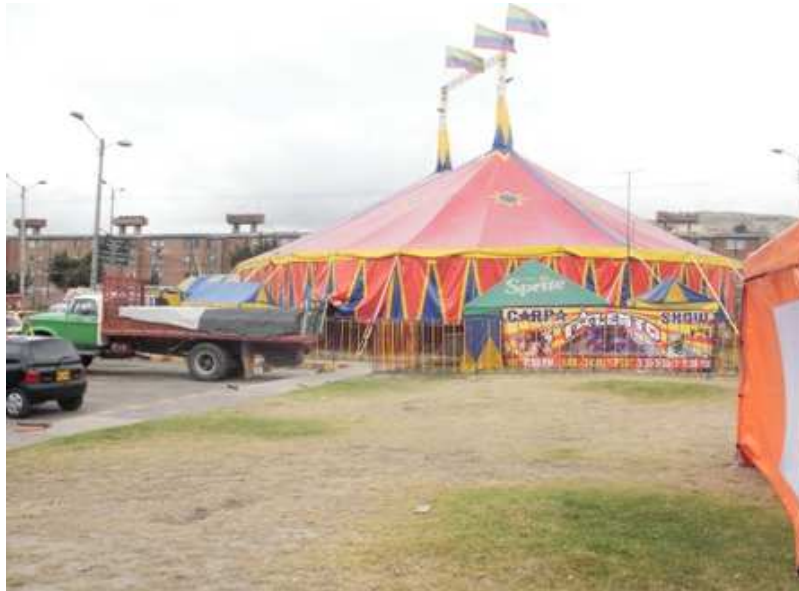
Diagonal 59 C sur Carrera 37. Ciudad Bolívar.