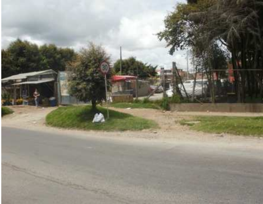
Calle 151 B Carrera 115, Suba.