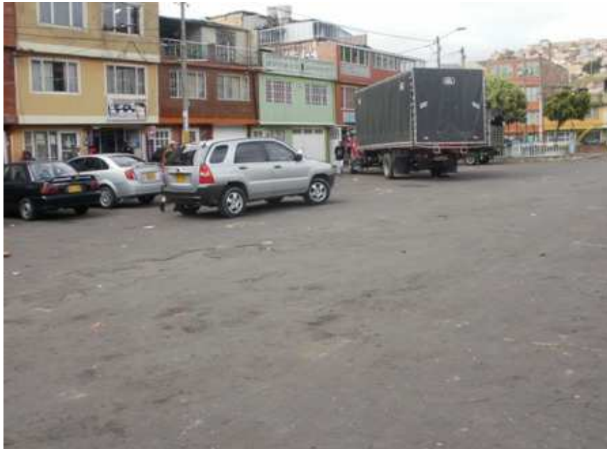
Calle 64 Sur Carrera 37. Ciudad Bolívar.