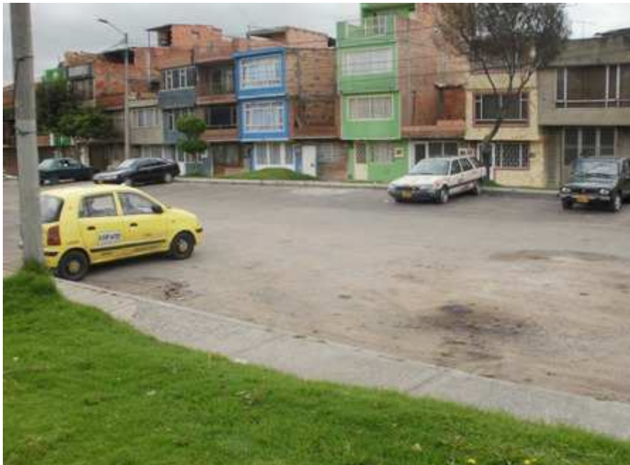
Calle 59 Bis sur Carrera 41. Ciudad Bolívar.