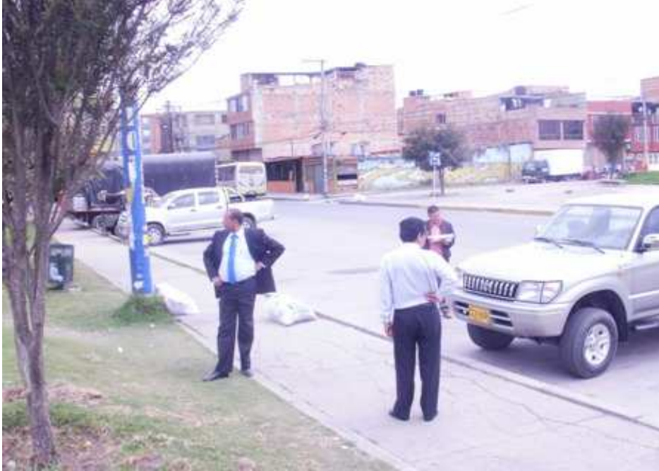
Calle 151 Bis Carrera 115 Suba