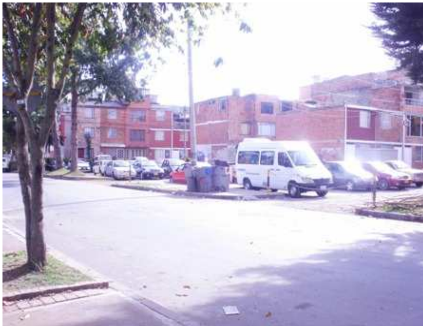
Calle 139 Carrera 118. Suba.