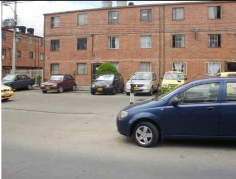
Carrea 113 C Calle 152, Suba.

“Por un control fiscal efectivo y transparente”