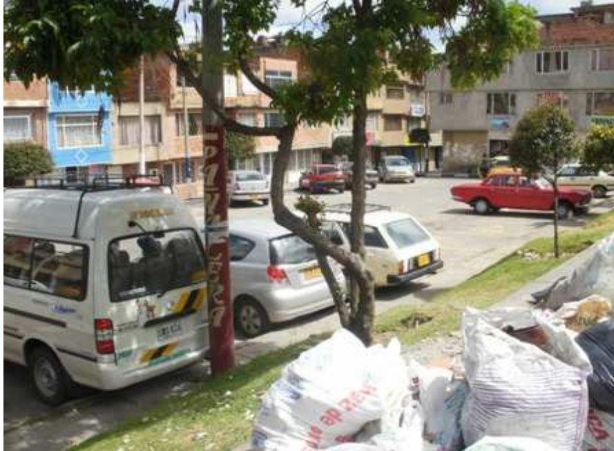
Calle 69 C sur Carrera 73 D. Ciudad Bolívar.