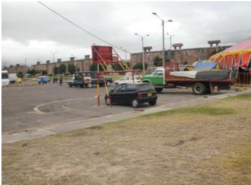
Diagonal 59 C sur Carrera 37. Ciudad Bolívar.