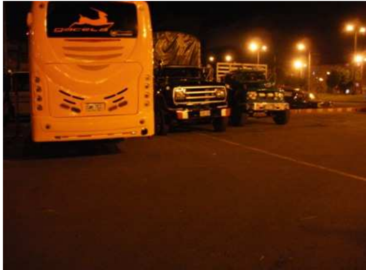
Diagonal 59 C sur Carrera 37. Ciudad Bolívar.