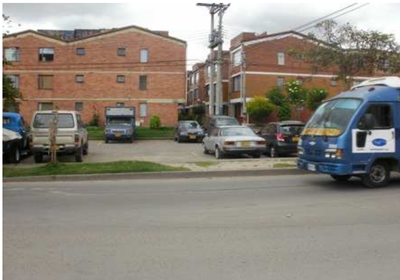
Calle 152 F Carrera 136 A, Suba.