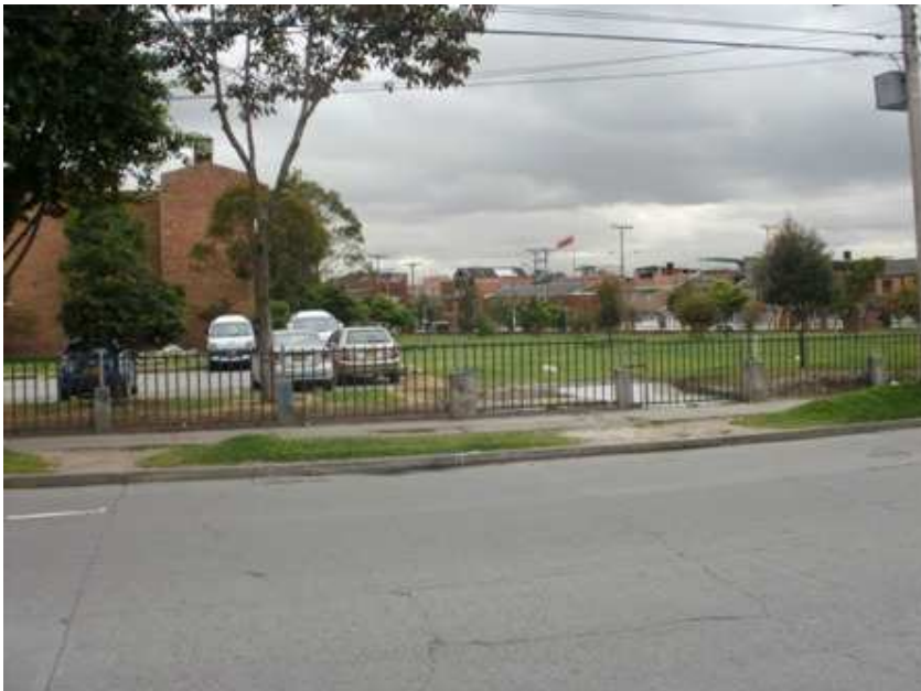
Calle 59 sur Carrera 49. Ciudad Bolívar.