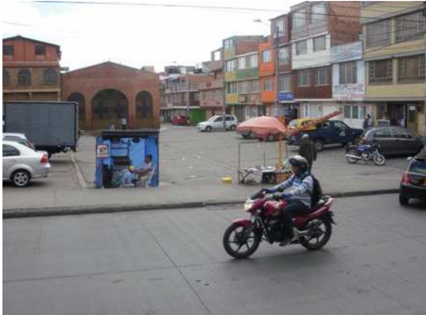
Calle 64 sur Carrera 34. Ciudad Bolívar.