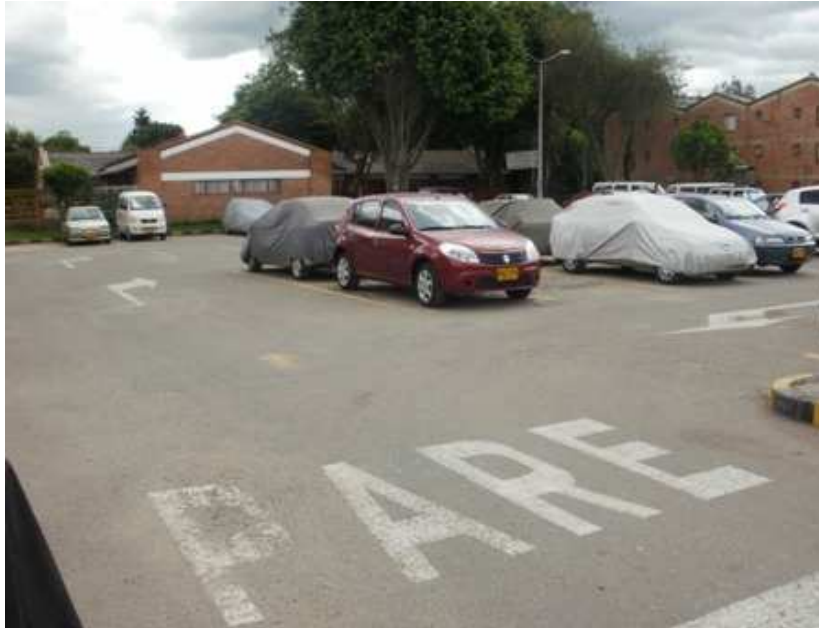
Calle 152 C Carrera 136, Suba.