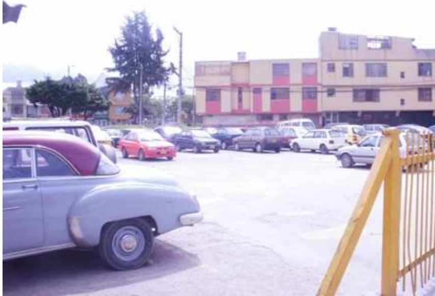
Calle 137 A Carrera 131. Suba.