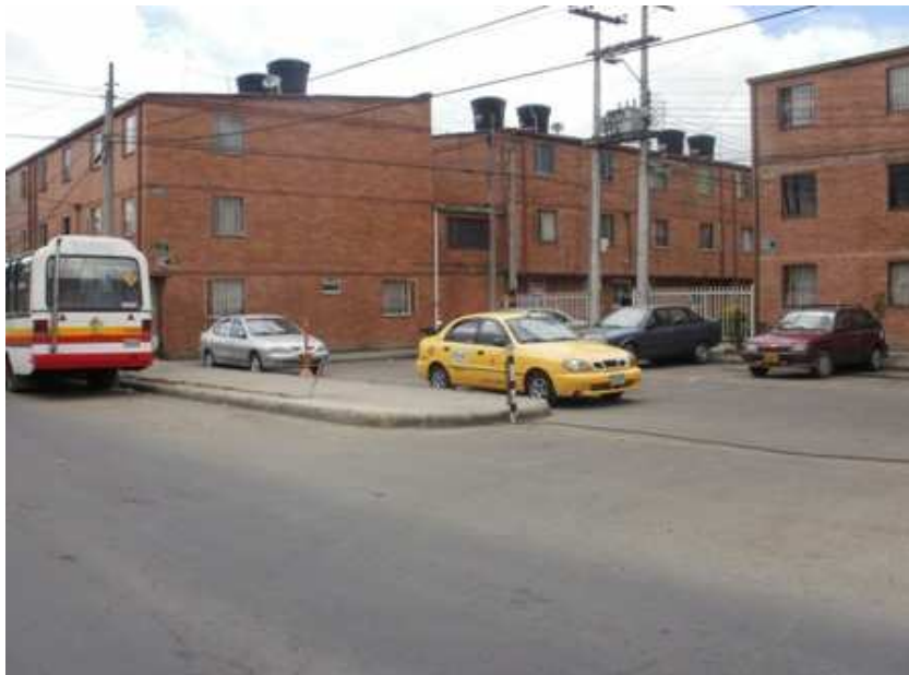
Calle 152 Carrera 109, Suba.