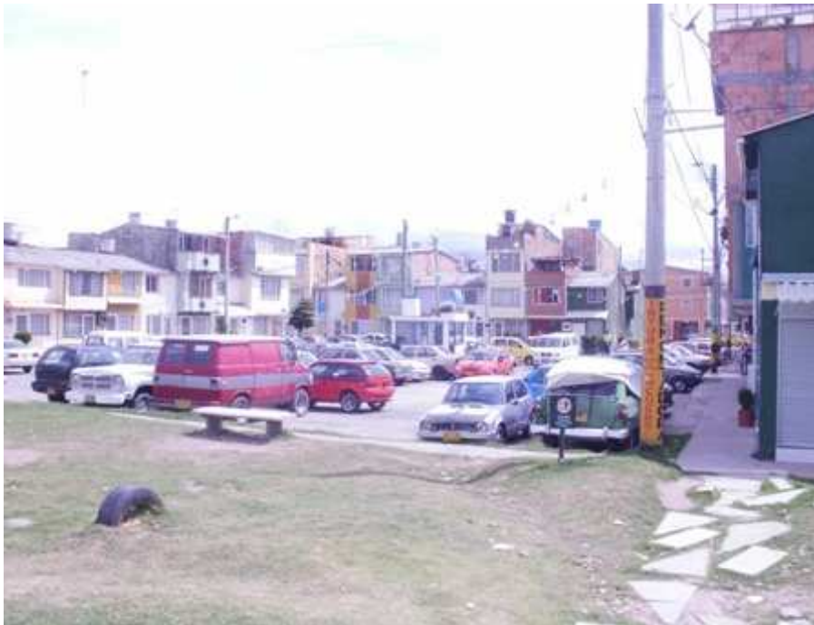
Calle 139 Bis Carrera 131. Suba.