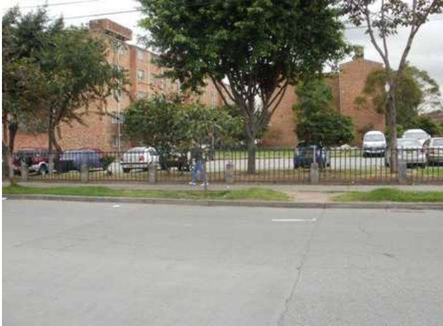
Calle 59 sur Carrera 49. Ciudad Bolívar.