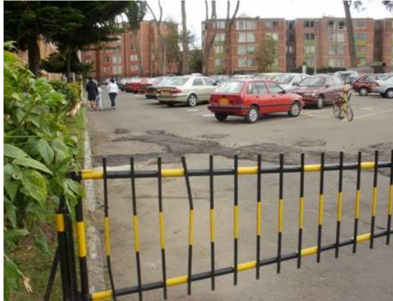
Calle 151 B Carrera 115, Suba.