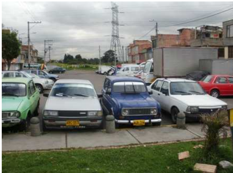
Calle 58 A sur Carrera 43 A. Ciudad Bolívar.