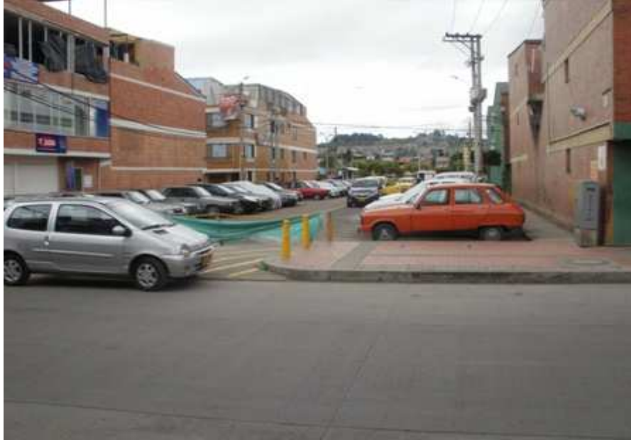
Calle 151 Bis Carrera 115 Suba

“Por un control fiscal efectivo y transparente”