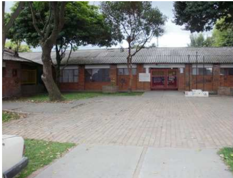
Calle 152 C Carrera 136, Suba.