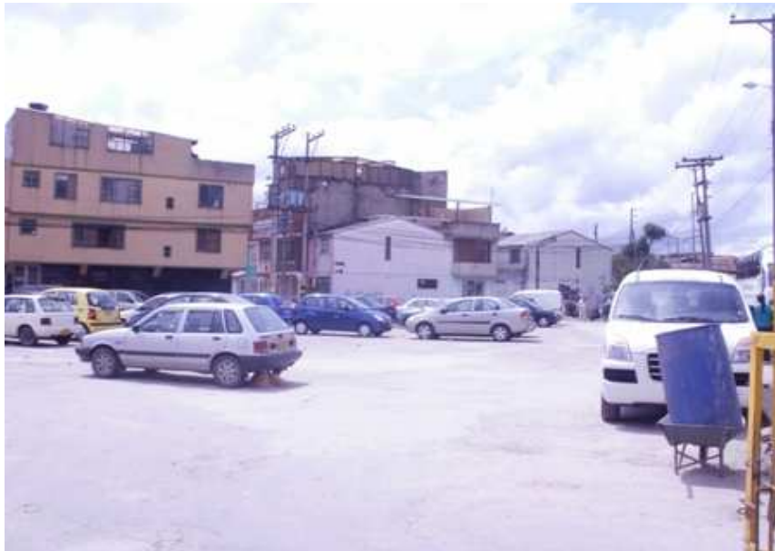
Calle 137 Carrera 128. Suba.