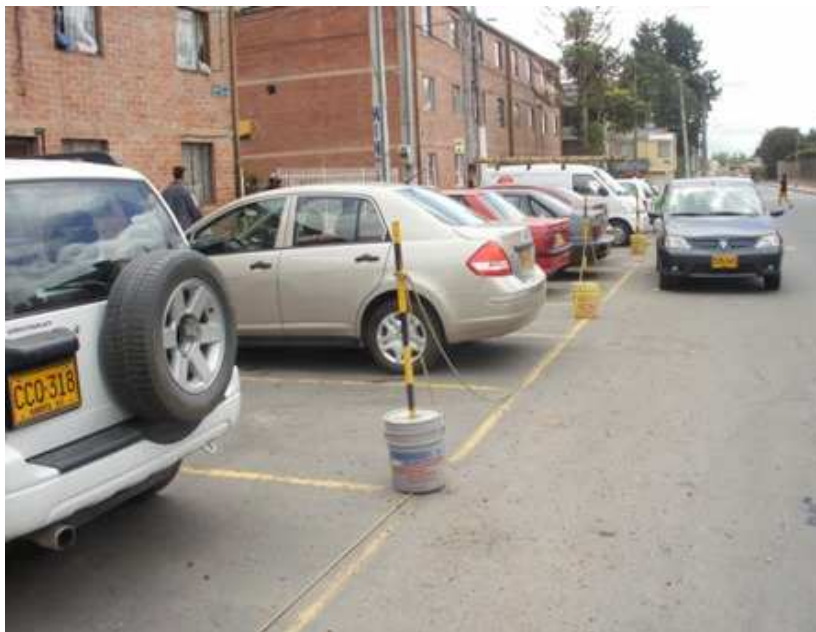
Carrera 113 C Calle 152, Suba.