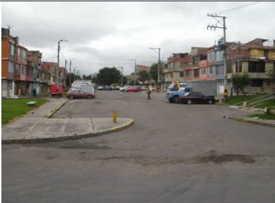
Calle 58 A sur Carrera 43 A. Ciudad Bolívar.