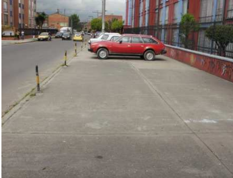
Calle 148 Carrera 114. Suba.

“Por un control fiscal efectivo y transparente”