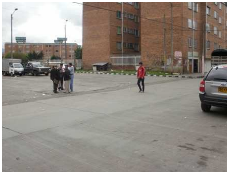
Calle 68 A sur Carrera 48 D. Ciudad Bolívar.