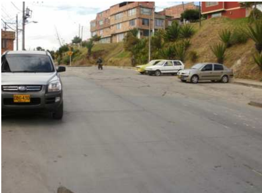
Calle 68 A sur Carrera 43. Ciudad Bolívar.