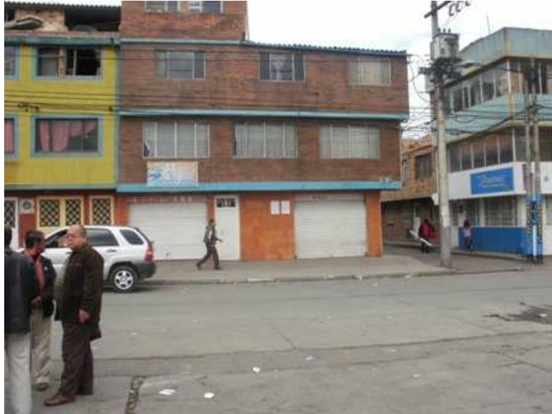
Calle 68 A sur Carrera 48 D. Ciudad Bolívar.