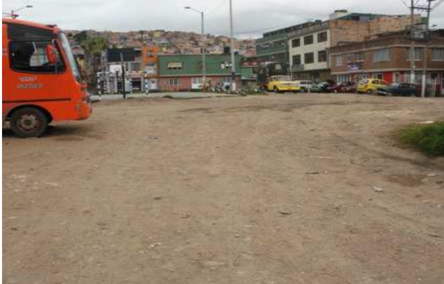
Calle 59 Bsur Carrera 45 D. Ciudad Bolívar.