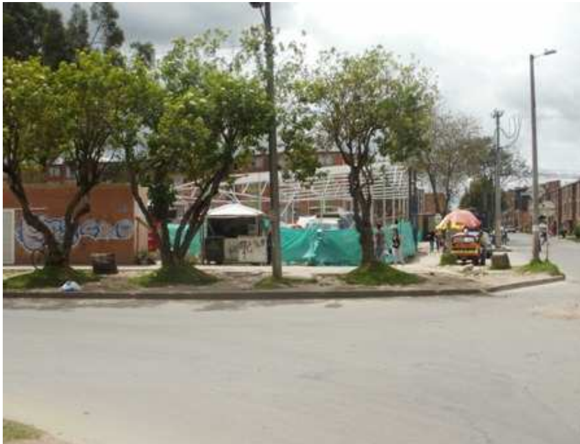
Calle 151 B Carrera 115, Suba.