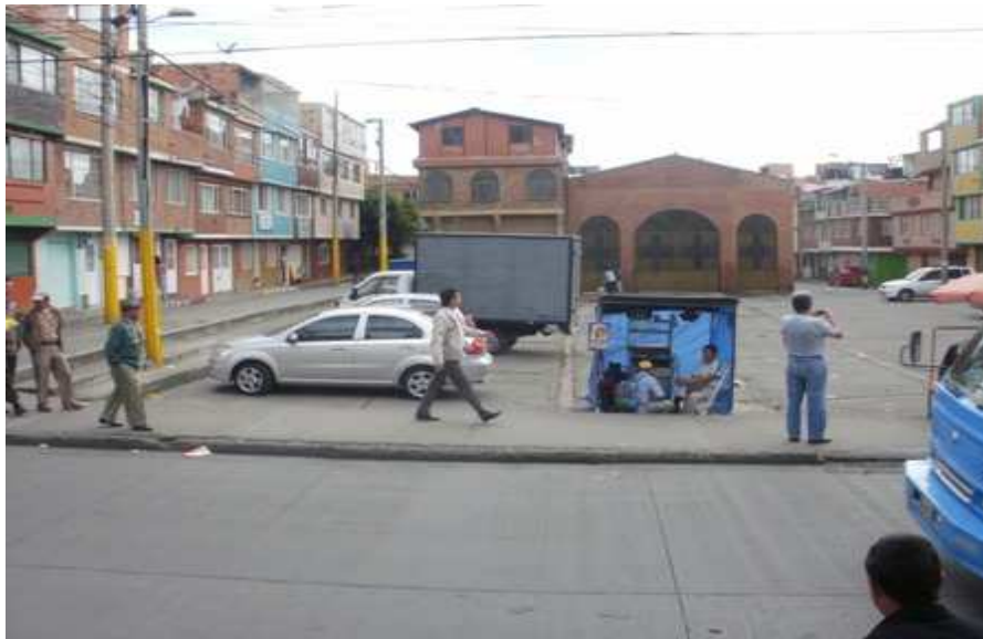
Calle 64 sur Carrera 34. Ciudad Bolívar.