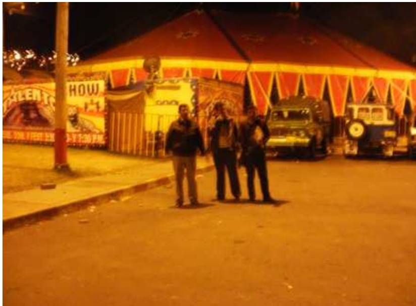
Diagonal 59 C sur Carrera 37. Ciudad Bolívar.