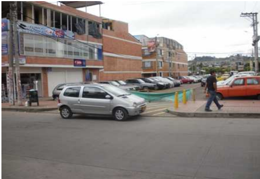
Calle 151 Bis Carrera 115 Suba