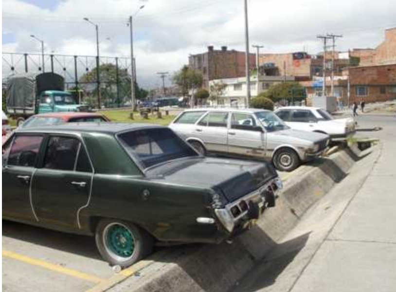
Calle 69 H bis Carrera 73 B. Ciudad Bolívar.

“Por un control fiscal efectivo y transparente”