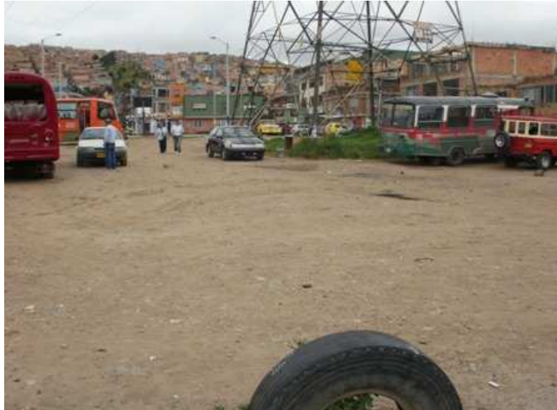
Calle 59 Bsur Carrera 45 D. Ciudad Bolívar.

“Por un control fiscal efectivo y transparente”