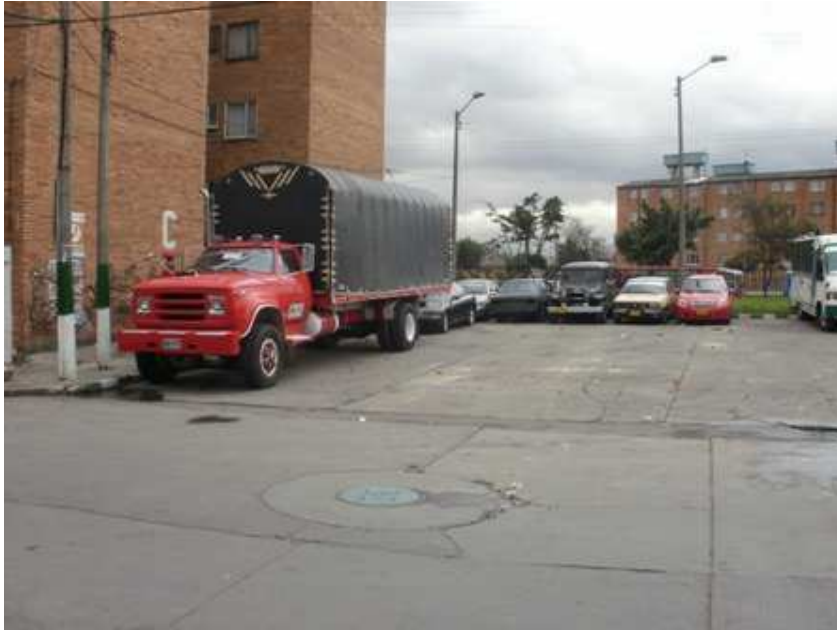
Calle 68 A sur Carrera 48 D. Ciudad Bolívar.