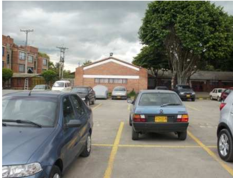
Calle 152 C Carrera 136, Suba.