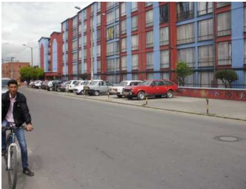
Calle 148 Carrera 114. Suba.