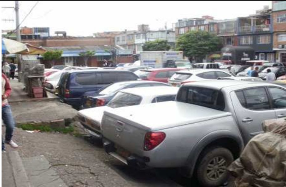
Calle 64 sur Carrera 29 Ciudad Bolívar.

“Por un control fiscal efectivo y transparente”