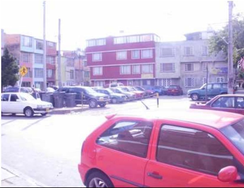
Calle 139 Carrera 118. Suba.