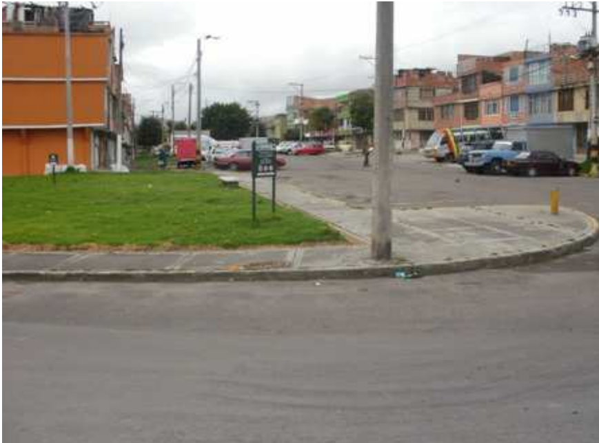
Calle 58 A sur Carrera 43 A. Ciudad Bolívar.