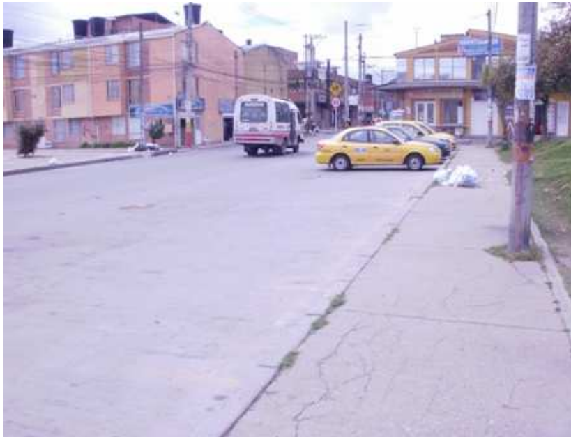
Calle 151 Bis Carrera 115 Suba