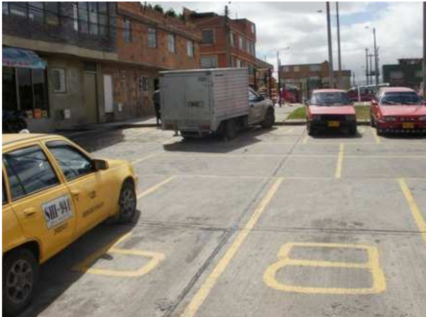
Calle 69 H bis Carrera 73 B. Ciudad Bolívar.