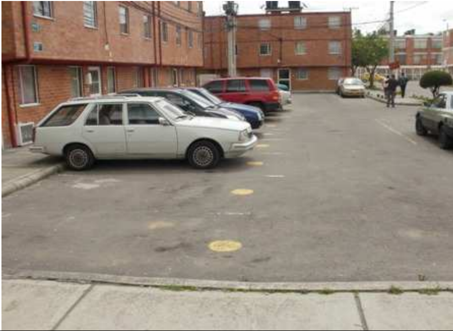
Carrera 114 D Calle 152, Suba.