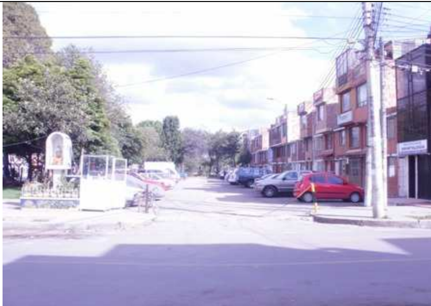
Calle 139 Carrera 118. Suba.