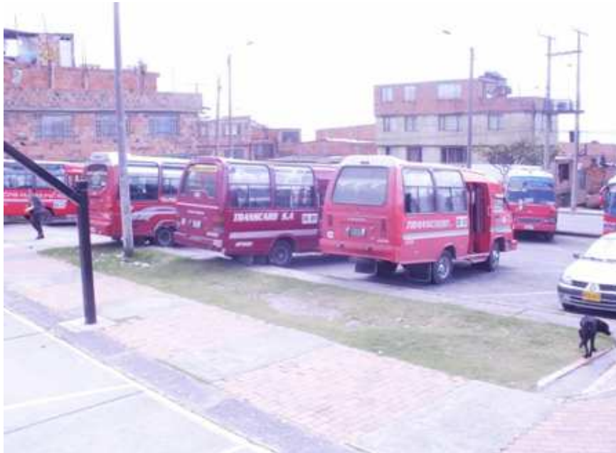
Calle 68 I sur Carrera 73 B. Ciudad Bolívar.