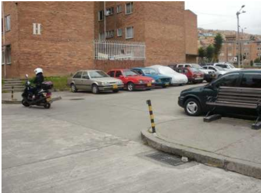
Calle 59 sur Carrera 49. Ciudad Bolívar.