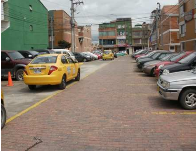
Calle 151 Bis Carrera 115 Suba