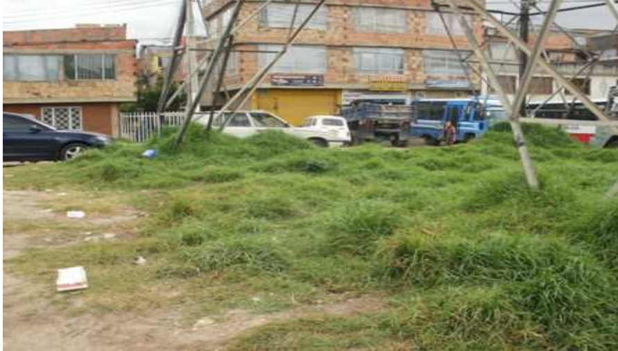
Calle 59 B sur Carrera 45 D. Ciudad Bolívar.

“Por un control fiscal efectivo y transparente”