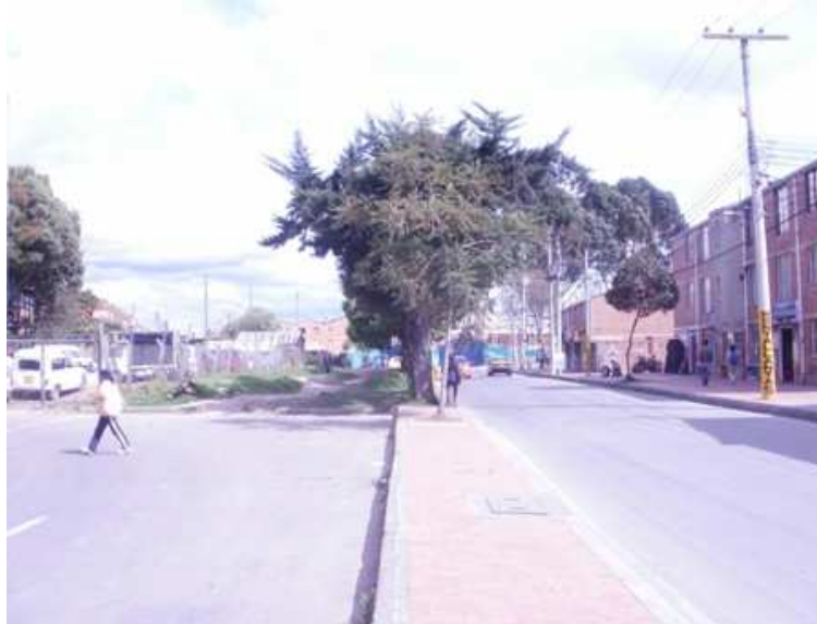
Calle 151 B Carrera 114. Suba.