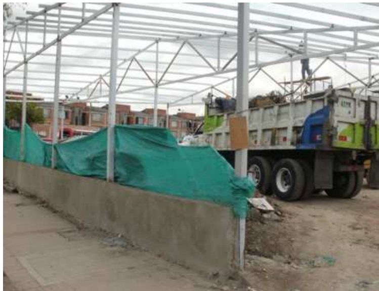
Calle 151 B Carrera 115, Suba.