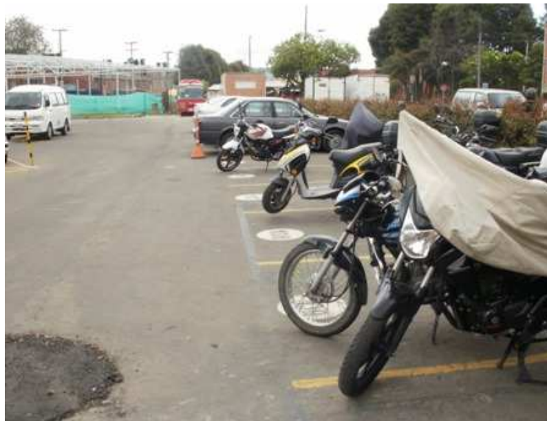
Calle 151 B Carrera 115, Suba.