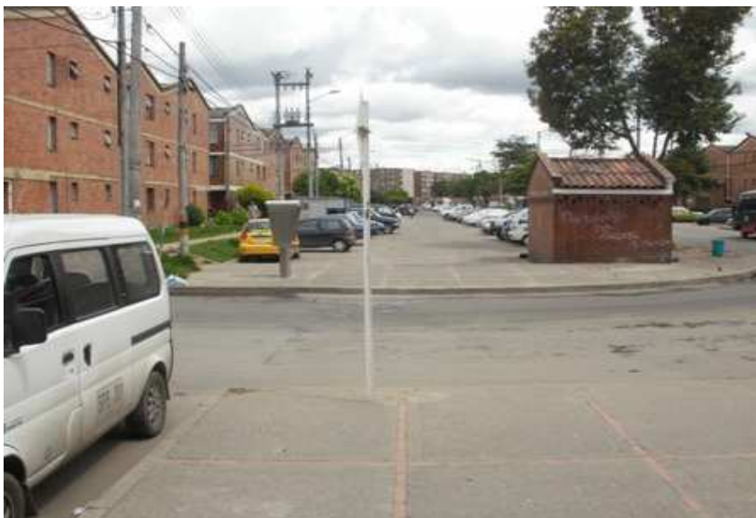
Calle 152 C Carrera 136, Suba.