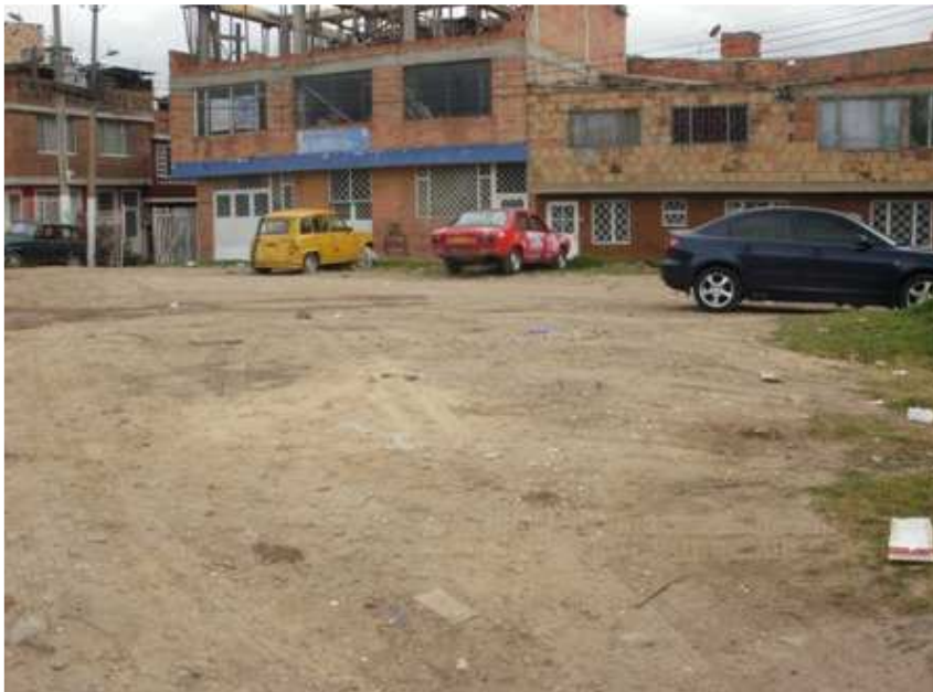
Calle 59 Bsur Carrera 45 D. Ciudad Bolívar.