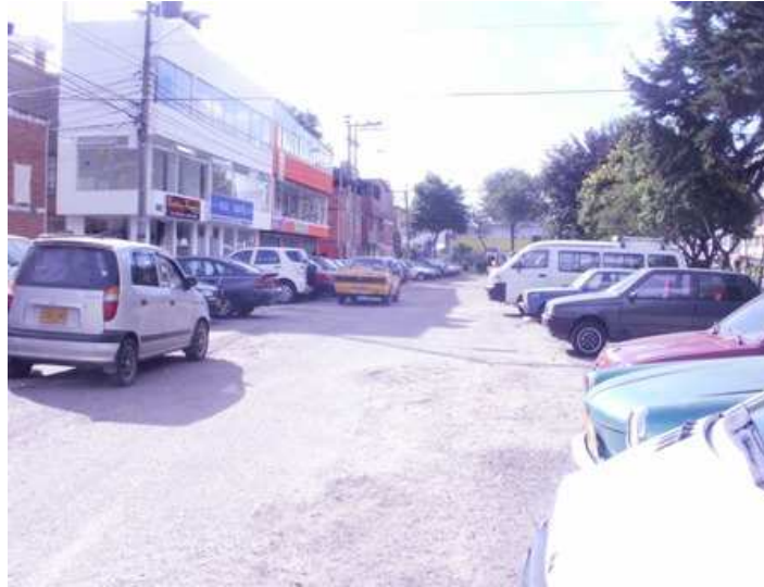
Calle 139 Carrera 114. Suba.