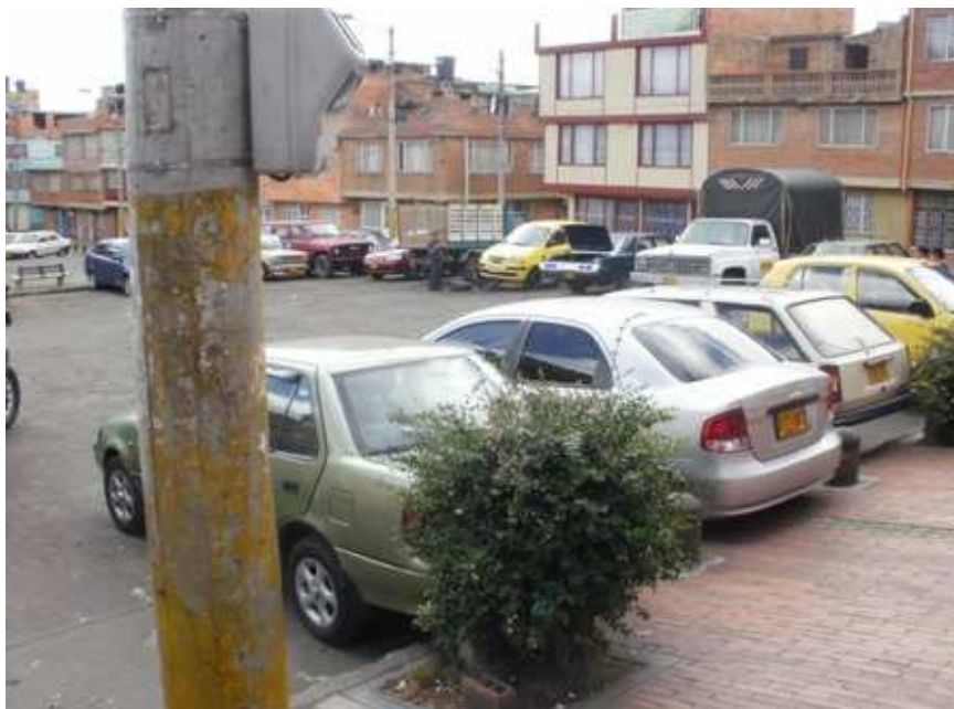
Calle 66 C sur carrera 29. Ciudad Bolívar.