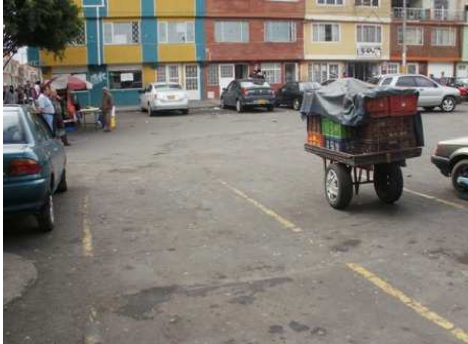
Calle 64 Sur Carrera 37. Ciudad Bolívar.