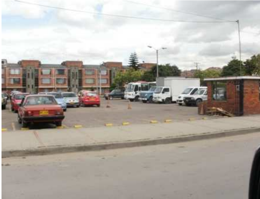
Calle 151 B Carrera 116, Suba.