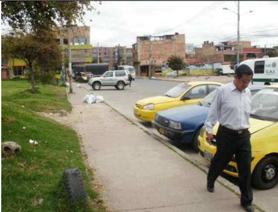
Carrera 113 C Calle 152, Suba.