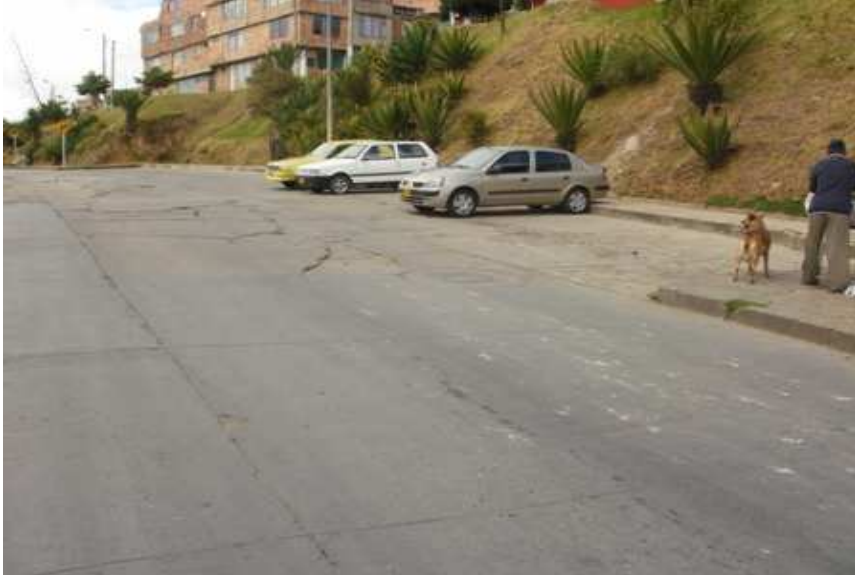
Calle 68 A sur Carrera 43. Ciudad Bolívar.

“Por un control fiscal efectivo y transparente”